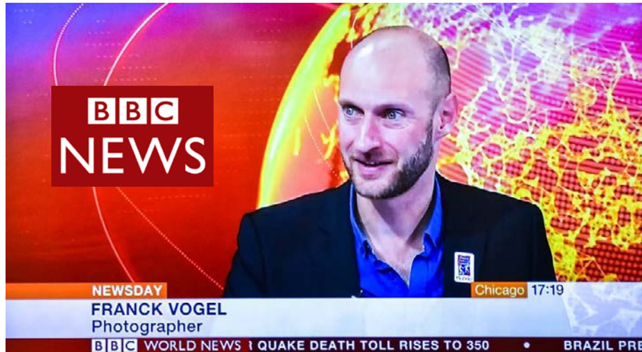
5 min de direct sur BBC News, studios de Singapour (16 avril 2016 - Audience 400 millions)