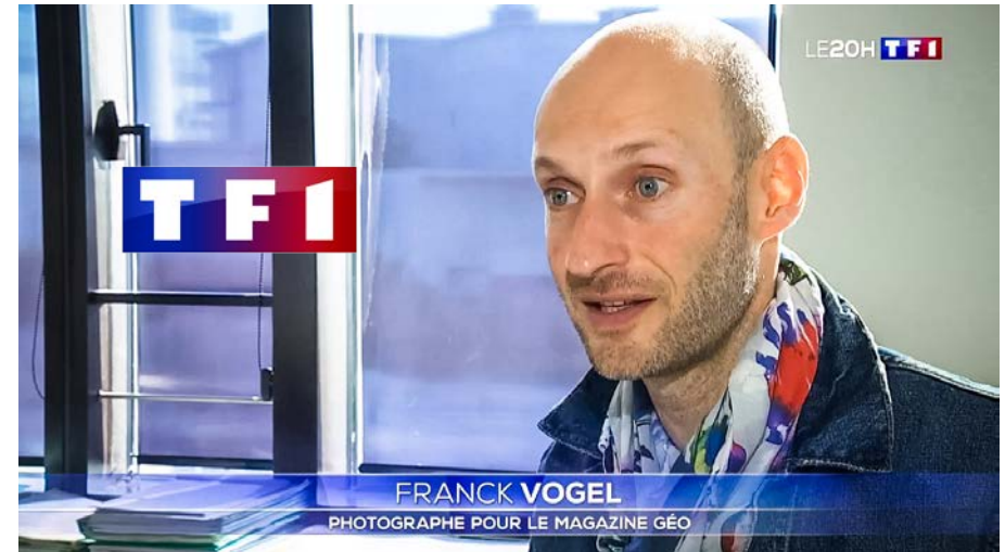
Interview dans le JT « Le 20 h » de TF1 (8 octobre 2018 - Audience 5,76 millions)