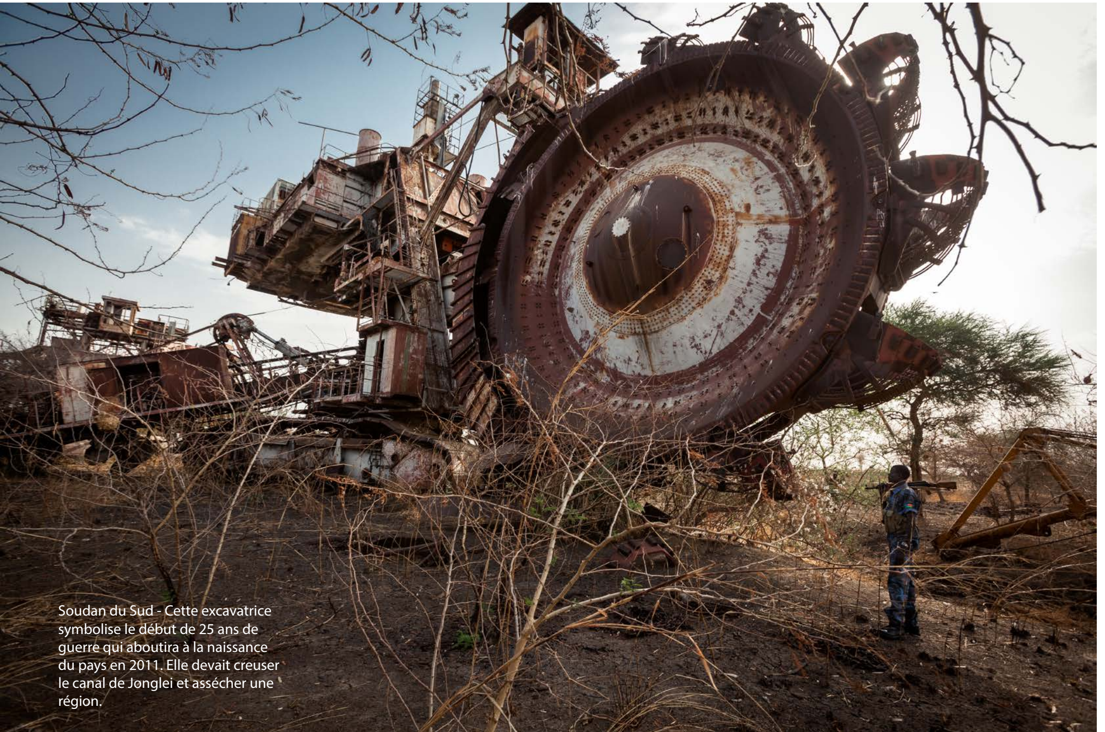
Soudan du Sud - Cette excavatrice symbolise le début de 25 ans de guerre qui aboutira à la naissance du pays en 2011. Elle devait creuser le canal de Jonglei et assécher une région.