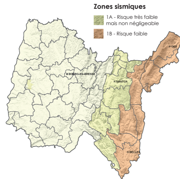
Zonage réglementaire actuel dans l'Ain

Selon les cas, les actions de diagnostic et de réduction de la vulnérabilité au séisme d'un territoire peuvent être conduites au niveau communal ou intercommunal.