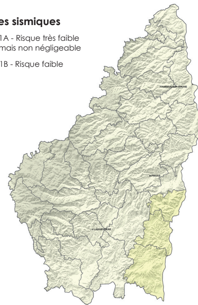
Zonage réglementaire actuel en Ardèche