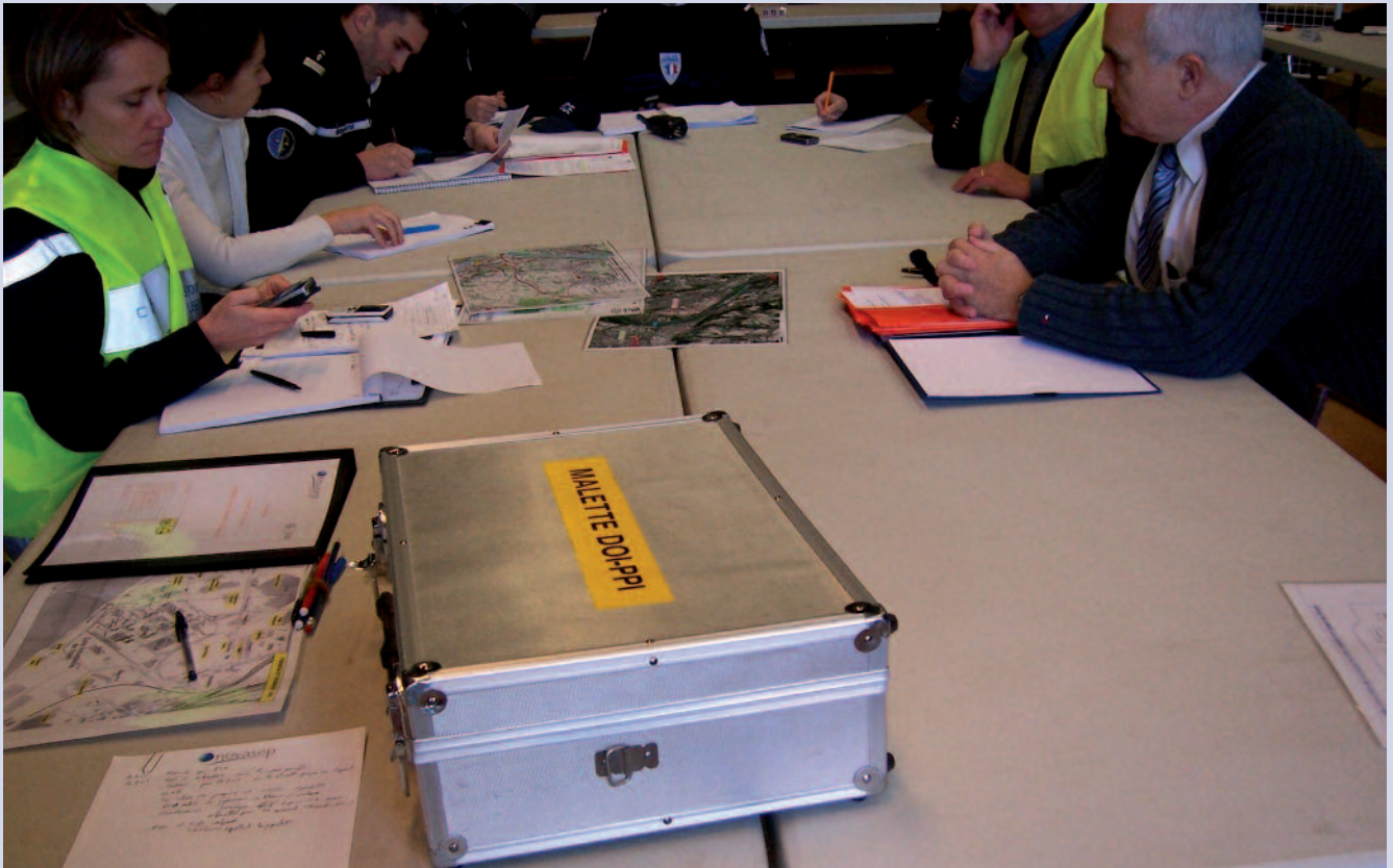
© L. Cassagne - IRMa - PCO de l'exercice Finorga (2008)

Nicolas REGNY, Chef SIDPC (Préfecture de l'Isère)