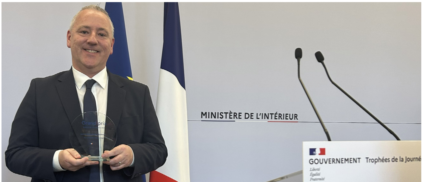
Geoffrey Mathon, Maire de Loos-en-Gohelle, lors de la remise du prix JNR à Paris le 19 décembre 2025