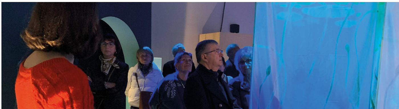
Résilience Tour 2025, étape Isère – Visite de l'exposition « Alp et le Dragon-rivière » à Cosmocité le 1 er décembre 2025 à Pont-de-Claix

ainsi la simple reconnaissance. Il constitue un marqueur fort de la politique menée à Loos-en-Gohelle, incarnant l'ambition collective de se préparer ensemble pour renforcer la résilience de notre territoire.